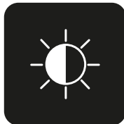
Sistema de iluminación