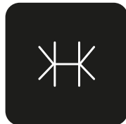
Doble vidrio templado